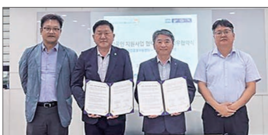
익 증진을 위한 지식재산 지원 사업 발굴 ▲소상공인 대상 공동사업 안내 등이다.

제주특별자치도경제통상진흥원 소상공인 경영지원센터(센터장 고행범)는 지난 1일 제주상공회의소 제주지식재산센터(센터장 오용석)와 '소상공인 지원 사업 연계 협력'을 위한 협약을 체결했다. 협약은 ▲소상공인의 권