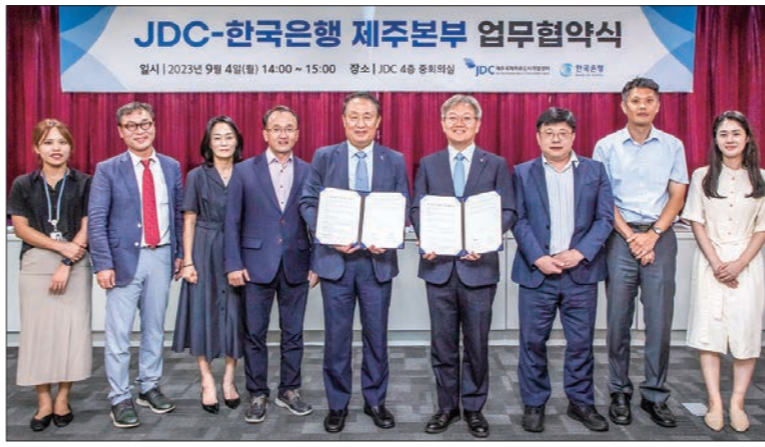
한국은행 제주본부와 제주국제자유도시개발센터는 4일 첨단과학기술단지 입주 기업 지원을 위한 업무 협약을 체결했다.

특히 JDC가 추천하는 제주첨단과학기술단지 내 입주 중소기업은 앞으로 '한국은행 제주